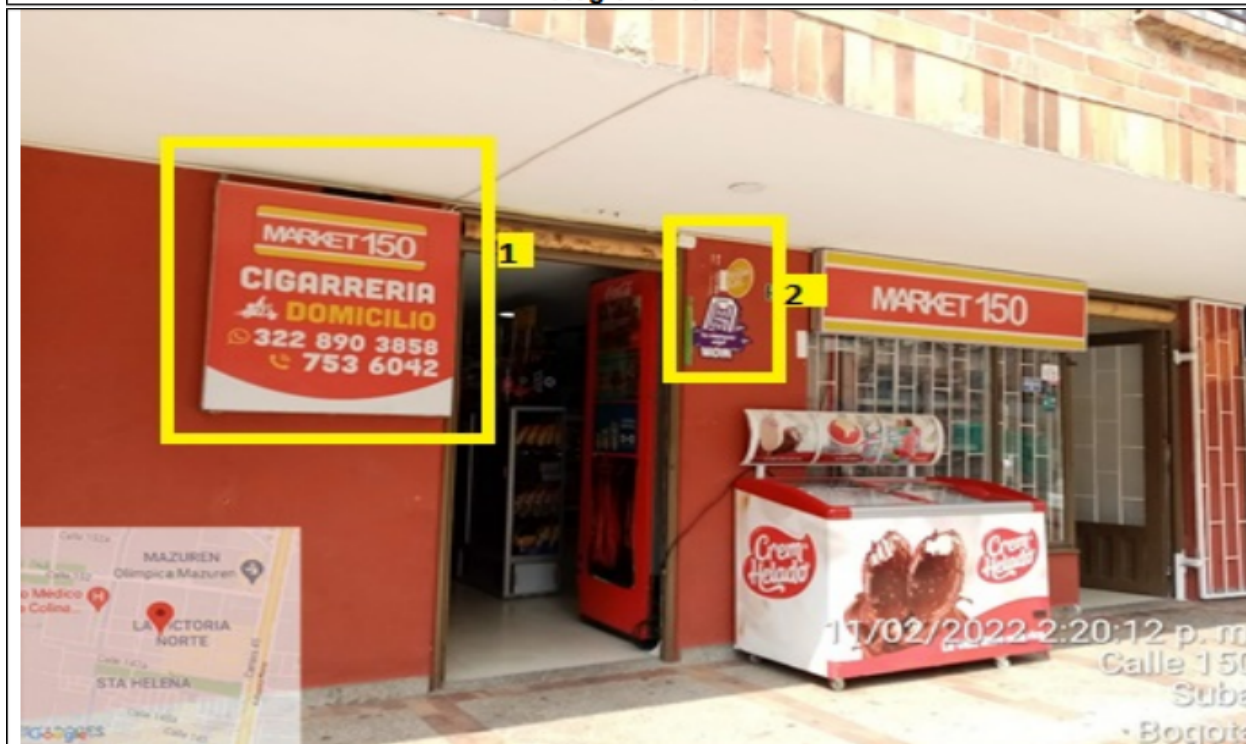
Fotografía No. 4

En la cual se evidencian dos (2) elementos publicitarios pertenecientes al establecimiento MARKET 150 , los cuales son adicionales al único elemento permitido por fachada de establecimiento.